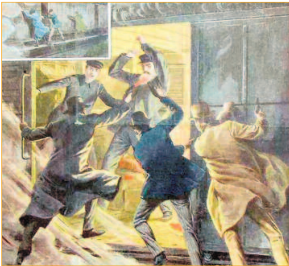
L'attaque surprise du train express fait la une du "Petit journal".

Vers 4h du matin, le convoi en provenance de Limoges quitte la gare d'Etampes avec à son bord des passagers et un fourgon poste. Quatre kilomètres plus loin, avant d'arriver à Etréchy, des travaux sur la voie ralentissent le convoi. C'est le moment que choisissent trois malfaiteurs pour remonter le train et pénétrer dans le fourgon de tête. Ils tombent nez à nez avec le chef de train et un fourgonnier qui trient des sacs postaux. Un des deux employés se jette sur eux, son collègue bloque les freins du train mais un des bandits réplique à coups de revolver. Les trois malfaiteurs s'emparent de huit coffrets et sautent