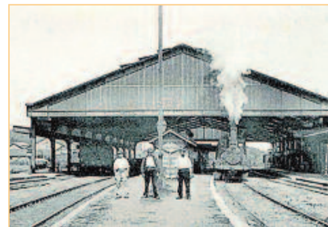
C'est à la sortie de la gare d'Etampes que le train a été attaqué.