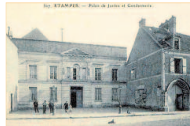
Etampes au centre d'une longue enquête (cliché de 1907).

Pourquoi deux billets ont-ils été oubliés dans un coffret ? Pour que le partage soit équitable. Après leur fuite, les trois hommes ont marché de nuit jusqu'à La Ferté-Alais puis ont