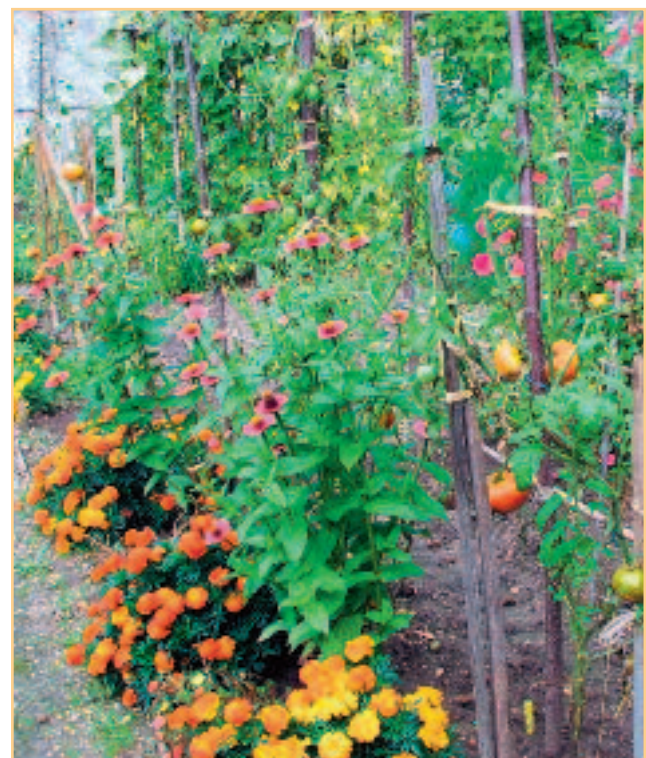
Fleurs et légumes réconciliés dans le potager du Parc Caillebotte de Yerres.

• Exposition "Du potager au gazon chéri" jusqu'au 19 avril les mercredis et samedis de 14h à 18h. Entrée libre. Maison de Banlieue et de l'Architecture : 41, rue G.-Anthonioz-de-Gaulle, Athis-Mons. Tél. 01.69.38.07.85.