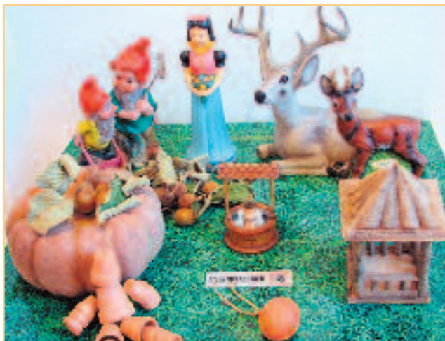
Dans les jardins, tous les styles sont possibles !