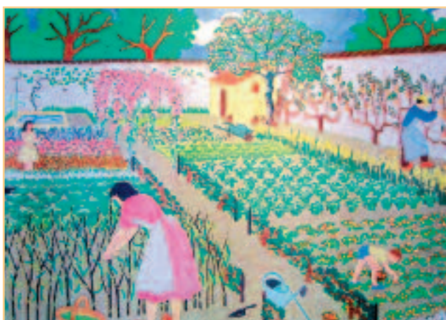
Toute la famille travaille au potager sur cette affiche venant d'une école de Juvisy-sur-Orge.