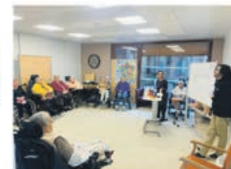
Deux animateurs diplômés proposent quotidiennement joie et stimulation

Avec ses nouvelles installations, ses services variés et son équipe dévouée, ce nouvel établissement se positionne comme un vrai havre de paix délivrant des soins de qualité.